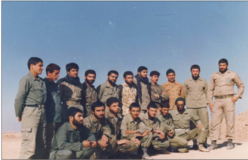
تصویر همهی برادران اطلاعات عملیات تیپ ۱۱۰ شهید بروجردی