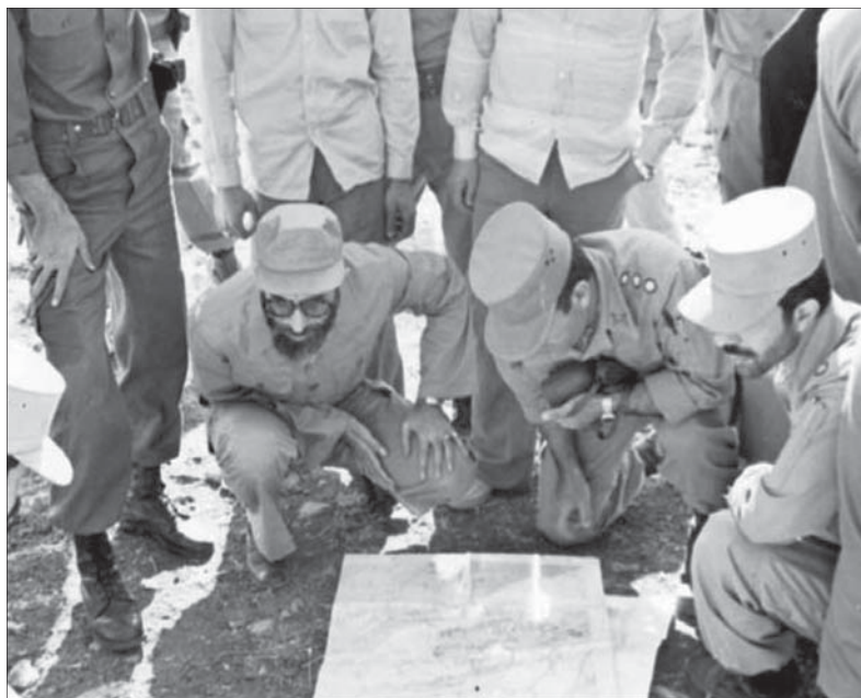
مقام معظم رهبری حضرت آیت‌الله خامنه‌ای (مدظله) به‌همراه شهید صیادشیرازی در حال بررسی منطقه عملیاتی سومار، عملیات مسلم بن عقیل (ع)

سپاه و ۲ تیپ از ارتش، بررسی وضعیت نیروهای عراقی در منطقه عملیاتی، تعیین مأموریت‌های هوانیروز و نیروی هوایی و برآورد استعداد لازم برای اجرای مأموریت آنها و برآوردهای اولیه برای چگونگی استقرار پدافند هوایی، از موضوعاتی بود که در این جلسه درباره آنها بحث شد. دومین جلسه نیز با چهار روز فاصله در ۲۷ مهر ۱۳۶۱ برگزار شد و در این جلسه