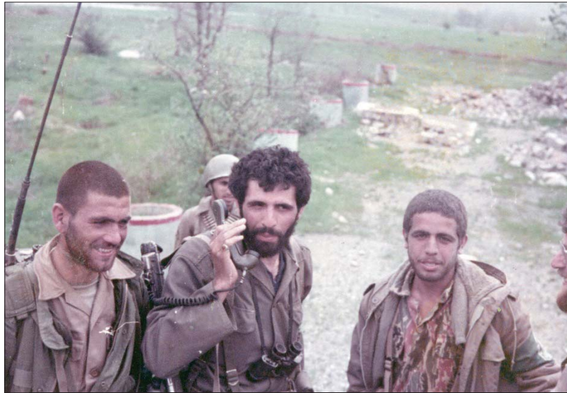
ناصر کاظمی فرمانده سپاه استان کردستان

جبهه جنوب در حال اجرا بود و با عنایت به لزوم و پشتیبانی و تسهیل عملیات نیروهای خودی در منطقه جنوب، نیاز به اجرای عملیات در منطقه شمال غرب بیشتر احساس می شد؛ بنابراین اجرای عملیات محمد رسول الله (ص) دشمن را وادار به انتقال و گسترش نیرو و گشایش جبهه جدید می کرد. ۱۴ حاج احمد متوسلیان از فرماندهان این عملیات، اهداف عملیات مزبور را چنین تشریح کرده است: «در این عملیات قصد ما این بود که در منطقه غرب، جبهه‌ای علیه ارتش عراق باز شود تا بدین وسیله ارتباط نیروهای عراقی و خطوط دشمن را از جنوب به طرف شمال، تجزیه و قطع کنیم.» ۱۵ از این رو، می توان در سطح کلان و راهبردی جنگ، این عملیات را در جهت تثبیت دستاوردهای عملیات طریق القدس در جبهه جنوب ارزیابی کرد؛ زیرا اجرای آن می توانست جبهه جدیدی را در مقابل نیروهای دشمن گشوده، با مشغول کردن