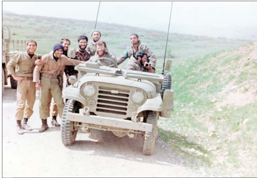
شهید محمد بروجردی فرمانده سپاه منطقه ۷ در پشت فرمان جیب فرماندهی