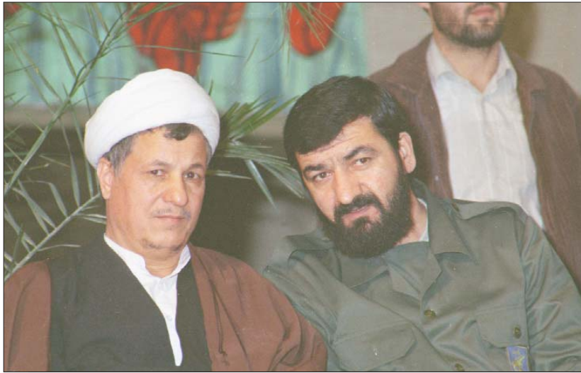
محسن رضایی و هاشمی رفسنجانی فرمانده سپاه و فرماندهی جنگ در دوران دفاع مقدس

فعالیت‌های خودی، دشمن هم بمباران‌ها را شروع کرده است و نشان می‌دهد که با این موضع‌گیری‌ها، آنها هم موضع‌گیری متقابل کرده‌اند.