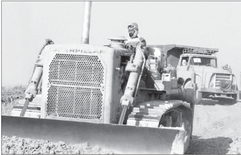
جهادسازندگی در حال احداث جاده در منطقه عملیاتی والفجر ۸.