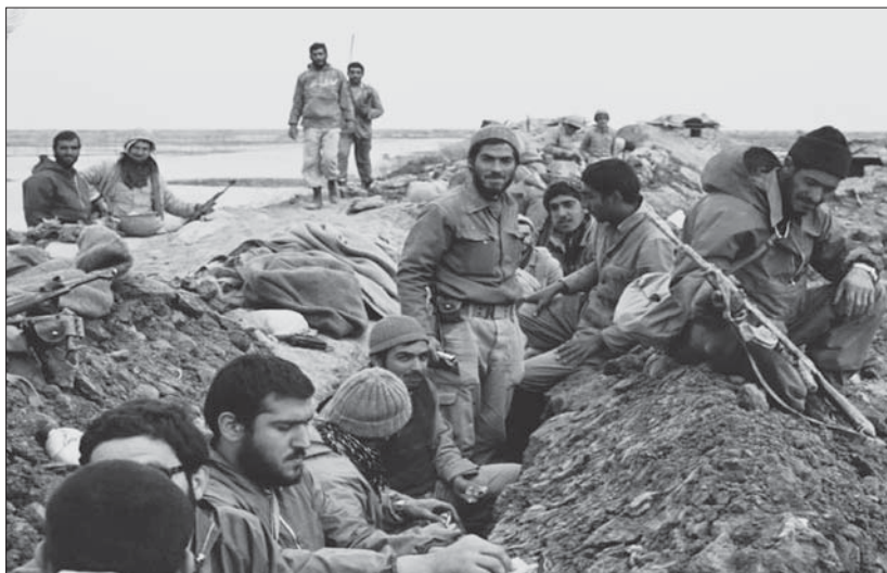
— رزمندگان لشکر ۳۱ عاشورا در عملیات کربلای ۵

قرارگاه کربلا با عبور لشکرهای ۲۷ و ۱۰ از کانال ماهی، درصدد تقویت آن جبهه و تسهیل الحاق با جبهه پنج‌ضلعی برآمد. اهمیت جبهه کانال ماهی و الحاق با پنج‌ضلعی باعث شده بود که دشمن بخش اعظم تلاش خود را معطوف به عقب راندن نیروها از غرب کانال کند و برای جلوگیری از الحاق در مثلث نوک کانال ماهی مدام فشار آورد.