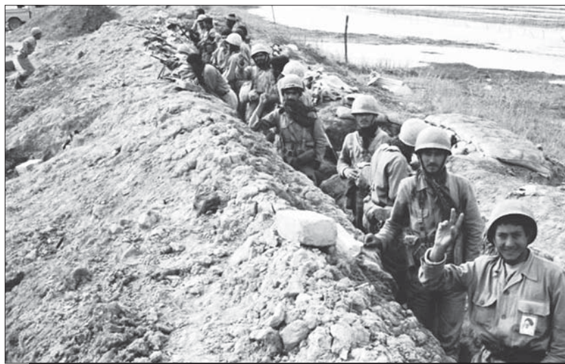
رزمندگان لشکر ۳۱ عاشورا در خط مقدم شلمچه در عملیات کربلای ۵

موفقیت تیپ‌های لشکر عاشورا در شکستن خطوط دشمن، اگرچه با ورود بخشی از عناصر این تیپ به محور پنج‌ضلعی کامل شده، ولی هنوز با تکمیل اهداف خود فاصله زیادی داشت ارتش عراق نیز با درک اهمیت منطقه پنج‌ضلعی، در محور دژ خندق (ضلع مشترک پنج‌ضلعی و کانال ماهی) فشار خود را بر نیروهای لشکر عاشورا افزایش داد و تا بعدازظهر همین روز با شلیک تیر مستقیم به شدت مقاومت می‌کرد. (۳۱)