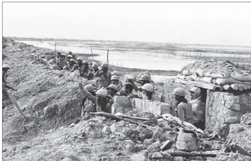
رزمندگان لشکر ۳۱ عاشورا - گردان امام حسین (ع)

در شب چهارم، نیروهای لشکر ۳۱ عاشورا بعد از چند شبانه‌روز نبرد پیاپی و فرسایشی، می‌بایست با دشمنی که مدام نیروی تازه‌نفس وارد صحنه می‌کرد و در مواضع مستحکم خود مستقر بود، مبارزه می‌کردند. در همین حال، قرارگاه قدس